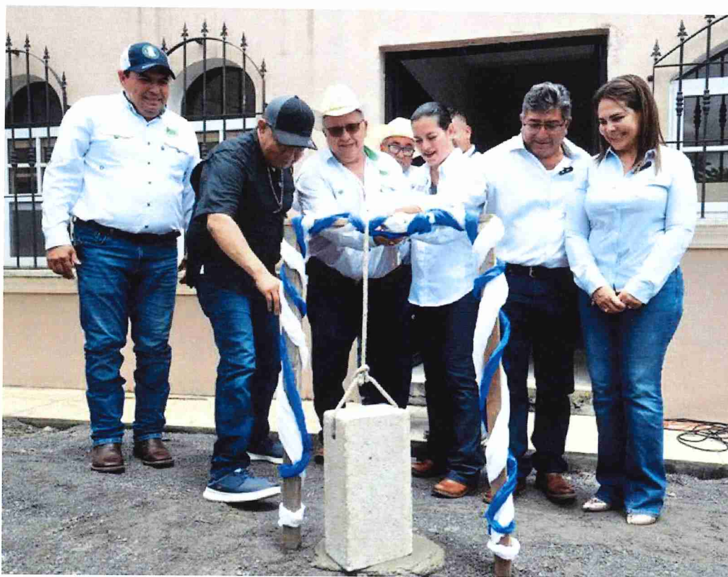
Figura 3. Inauguración simbólica del inicio del proyecto de la Asociación de Ganaderos de Izabal.