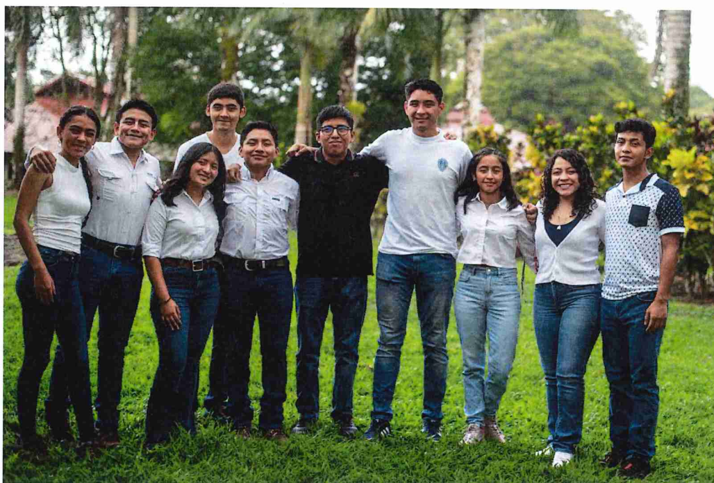
Figura 2. Estudiantes beneficiados por la Asociación AGROBECA en la Universidad EARTH.