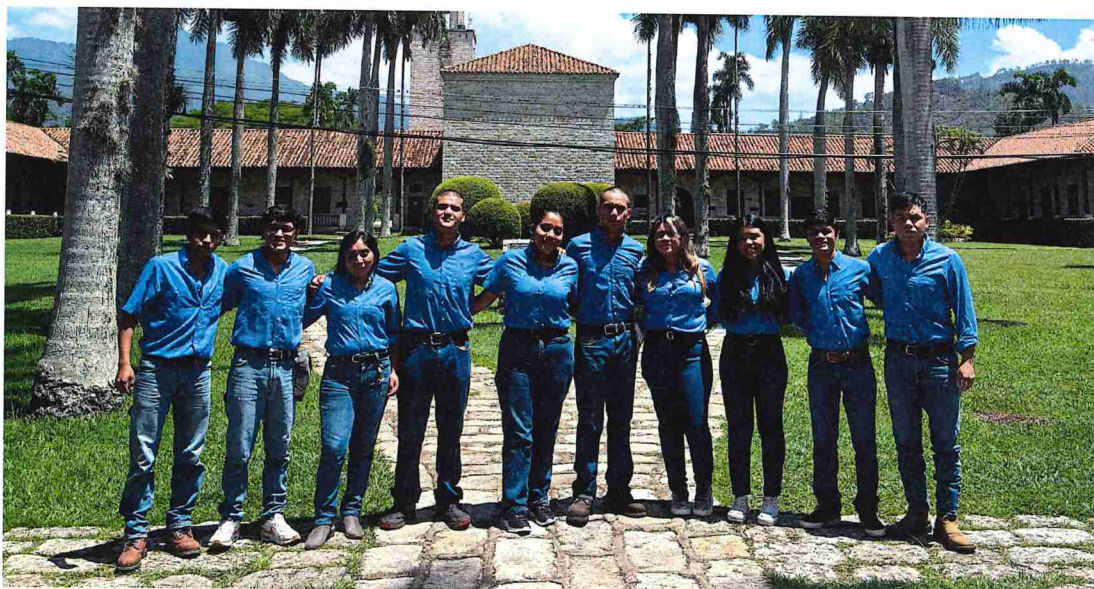
Figura 1. Estudiantes beneficiados por la Asociación AGROBECA en la Escuela Agrícola Panamericana Zamorano.